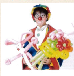
ようへいくん ピエロ