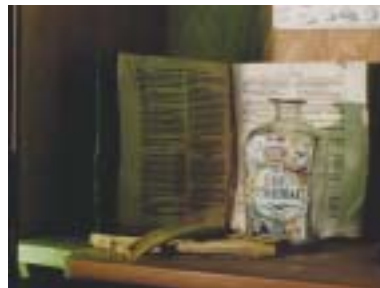
万能の解毒薬 テリアカ