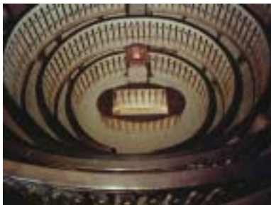
パドバ大学の人体解剖室(1549年建造)