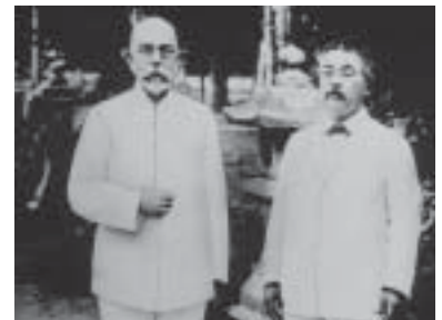
ロベルト・コッホと北里柴三郎