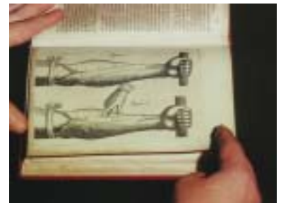
ハーベーの静脈弁説明図