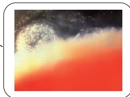
「横から拡大してみた胃粘膜」